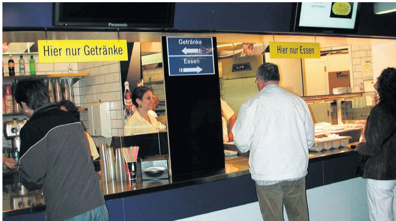
Dahinter steckt weder eine kleine Klitsche noch ein Grosskonzern, sondern seit drei Generationen ein Familienbetrieb.

In den Bereichen Arena und Conference Center können in den unterschiedlichen Restaurationstypen bis zu 15000 Personen verpflegt werden. Das Angebot wird anlassabhängig konzipiert und variiert: «Innerhalb von 24 Stunden müssen wir alles umbauen können», erklärt Wüger. Werden heute Konzertbesucher bedient, sind es morgen vielleicht Eishockeyfans mit ganz anderen Bedürfnissen. Für den Projektleiter Gastronomie – bei Hallenstadion-Dimensionen geht längst nicht mehr alles durch das Nadelöhr «Chef» – heisst das, vorausschauend zu planen, Mitarbeitende zu disponieren und entsprechend Waren