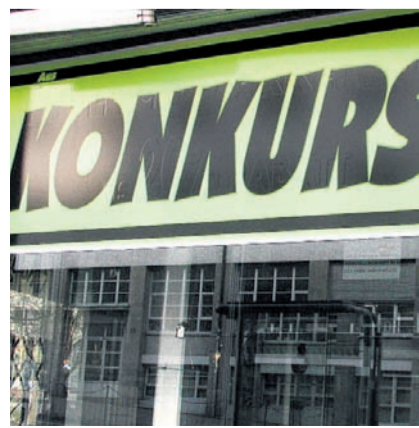
Die Konkurse sind schweizweit stabil.

In Thun haben vier Gastrobetriebe neu bis 5 Uhr offen