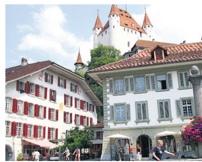
Blick in Thuns Altstadt mit Schloss.

Zudem müssen die Betriebe Fumoirs installieren. Dies stellt Regierungstatthalter Wytenbach als Bedingung. Der Einbau der Fumoirs sei ohne Baugesuch möglich, heisst es beim Statthalteramt. mmo/mn